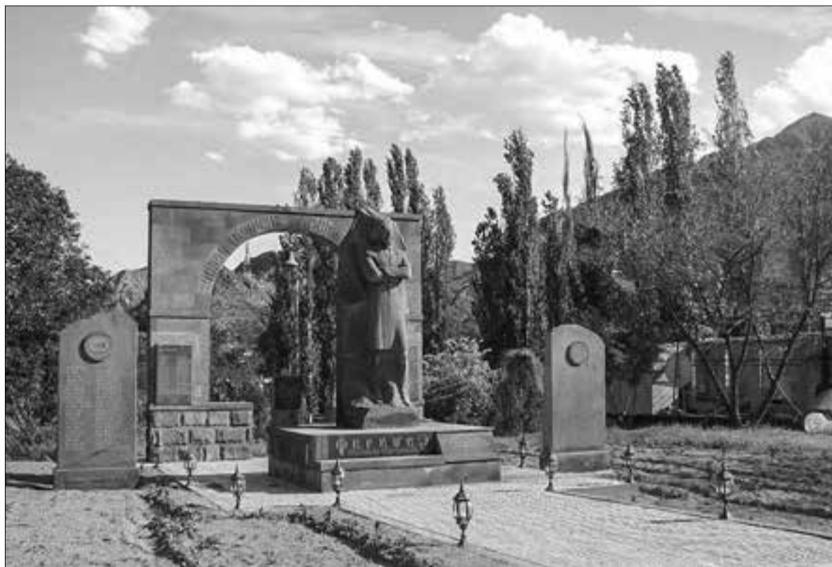
Փարամազի հուշարձանը Մեղրիում