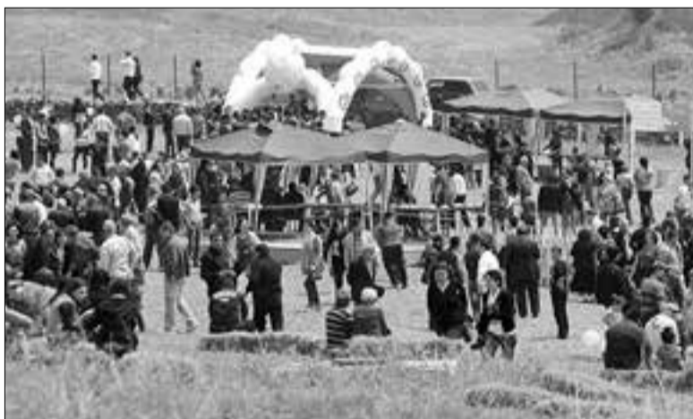
յաստանում, այլ նաև մեր տարածաշրջանում: Իսկ հիմա բուն ասելիքի մասին: Սայիսի 3-ին նախածեռնող, հայրենասեր մարդկանց, կազմակերպությունների շնորհիվ սովորականից մարդաշատ էր «Տաթևեր» ճոպանուղու Հալիծորի տեղամասի

Անցած դարի 70-ականներին տողերիս հեղինակը դեպի Տաթև է ուղեկցել ֆրանսահայ բանաստեղծ, Ֆրանսիայի գիտությունների ակադեմիայի անդամ Ռուբեն Մելիքին: Տաթևից վերադառնալու ճանապարհին շրջանի ղեկավարներն ի պատիվ մեր մեծ հայրենակցի Հալիծորի անտառում ծոխ սեղան էին բացել՝ մեր հող ու ջրի առատ, համ ու հոտով բարիքներով: Նրան հատկապես դուր էր եկել Որոտանի խորոված կարմրախայտը, Հալիծորի կարմիր գինին: Բանաստեղծի կողմից գինու գովասանքը լսելուց հետո երջանկահիշատակ Սաշիկ Հարությունյանը, ով այն ժամանակ Հալիծորի պետական տնտեսության տնօրենն էր, ծոցագրպանից հանեց բառածալ մի թուրք ու մեկնեց բանաստեղծին: Նա զարմացած վերցրեց այն ու սկսեց բացել: Բազում անգամ ծալվել-բացվելուց թուրքը համարյա չորս կտորի էր բաժանվել: Հեռվից նկատելի էր ոսկետառ տեքստը: Բանաստեղծը հայերեն դժվարությամբ էր խոսում, բայց ի զարմանս մեզ՝ հընթացս թարգմանեց: Վկայագիր էր՝ 1913 թվականին Փարիզում անցկացված գինիների մրցույթի մասին: Այն ի լուր աշխարհի հայտնում էր, որ գեղեցկության, մոդայի, սիրո, ոգելիչ խմիչքների համաշխարհային մայրաքաղաքում անցկացված մրցույթում Հալիծոր փոքրիկ գյուղից ուղարկված գինին շահել է գլխավոր մրցանակը: Չեմ ցանկանում ծավալվել: Բանաստեղծը տասնյակ անգամ լուսանկարեց վկայագիրը, իսկ մենք այնքան էինք ոգեւորվել, որ կարծես մեր պապերի արածի մեջ ներդրում ունենք: Փռք ու պատիվ մեր սերնդին, որ կարողացավ բազում արհավիրքների դիմակայել: Այսօր էլ խաղողի այր տեսակն էնդեմիկ է ոչ միայն Հա-