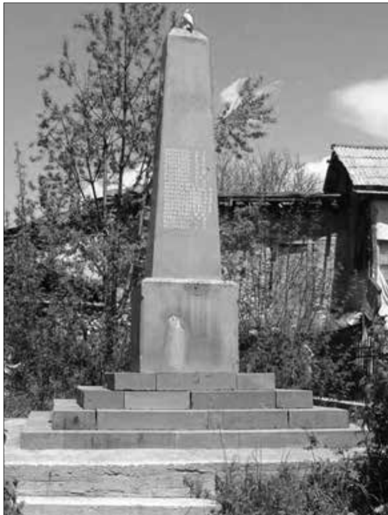
Մեծ հայրենականում զոհված կուրիսեցիների հիշատակը հավերժացնող հուշարձանը

հատկացնում են: Իրողությունն այն է, որ մինչ այժմ համայնքը բնապահպանական գումար չի ստացել: Սուրիկ Գրիգորյանից ցանկացանք իմանալ կարծիք համայնքների խոշորացման եւ միջհամայնքային միավորումների ձեւավորման մասին, ըստ որի ընդհանուր վարչական սահման ունեցող համայնքները միավորվում են, ավելի ստույգ՝ փոքրերը ձուլվում են խոշորներին: Մեր գրուցակիցն այն համոզմանն է (եւ միանգամայն տրամաբանական), որ այդ քայլը վերջնականապես կործանելու է փոքր համայնքները (խոսքը բնակչության թվի մասին է): Ըստ նրա, միավորվելու դեպքում ներդրումներ արվելու են խոշոր համայնքներում անտեսելով փոքրերը: Մանավանդ իրենց սահմանամերձ